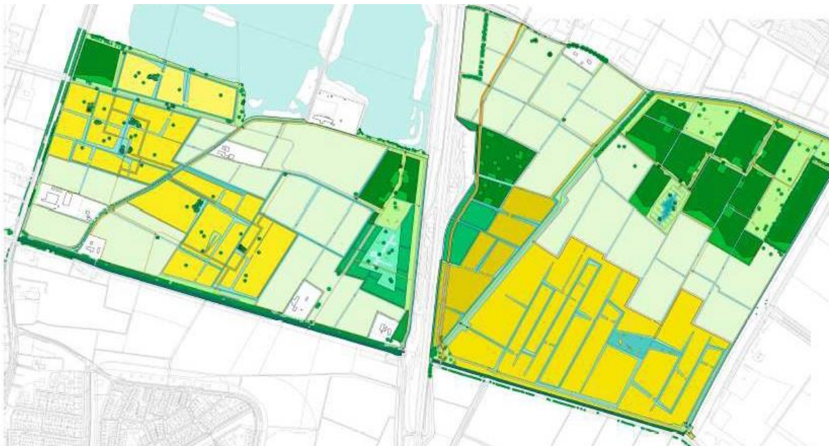
Afb. 1.1 Projectgebied

De komende jaren wordt in totaal zo'n 500 hectare parkgrond heringericht. Het Waterrijk, één van de vijf deelgebieden van het park, wordt een circa 325 hectare groot natuur- en recreatiegebied tussen Arnhem en Elst. Het Waterrijk wordt een waterrijk deelgebied van Park Lingezegen. Het geheel in de gemeente Overbetuwe gelegen Waterrijk ligt ingeklemd tussen Arnhem-Zuid en de Linge. In het westen grenst het parkdeel aan de Rijksweg Noord, aan de oostzijde wordt Het Waterrijk begrensd door een sloot langs kassengebied Bergerden. De midden door het parkdeel lopende snelweg A325 deelt Het Waterrijk in twee delen: Waterrijk-West en Waterrijk-Oost.