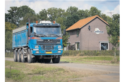
Vrachtwagen tijdens grondtransport in Park Lingezege.

Francien van Dijk coördineert de vragen die binnenkomen bij het meldpunt. Indien gewenst kunnen