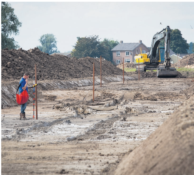
Graafwerkzaamheden in De Park voor de toekomstige watergangen, fiets- en skeelerpaden.

Op deze informatiepagina leest u eens in de twee maanden over actuele ontwikkelingen in Park Lingezege. De pagina vervangt de nieuwsbrief die het Projectbureau Park Lingezege enkele jaren uitgaf. Meer informatie vindt u ook op de website: www.parklingezege.nl .