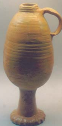
Raadskan uit ca. 1500