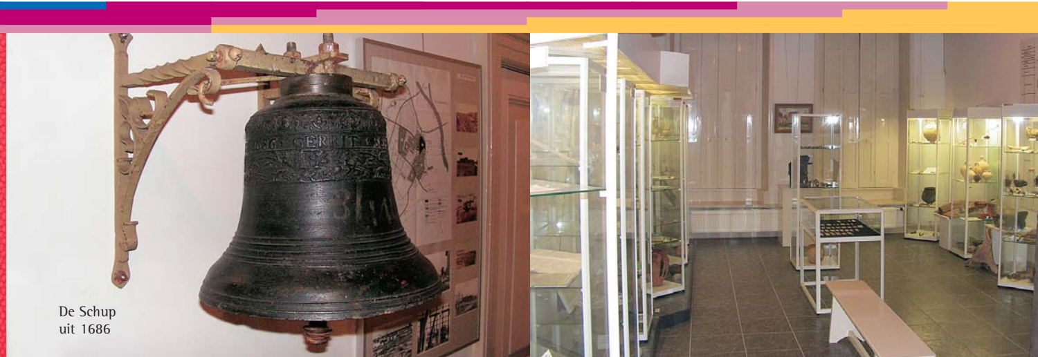
De Schup uit 1686