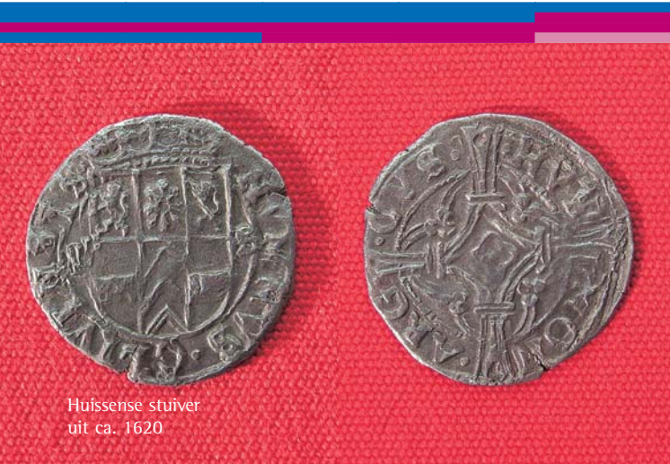
Huissense stuiver uit ca. 1620